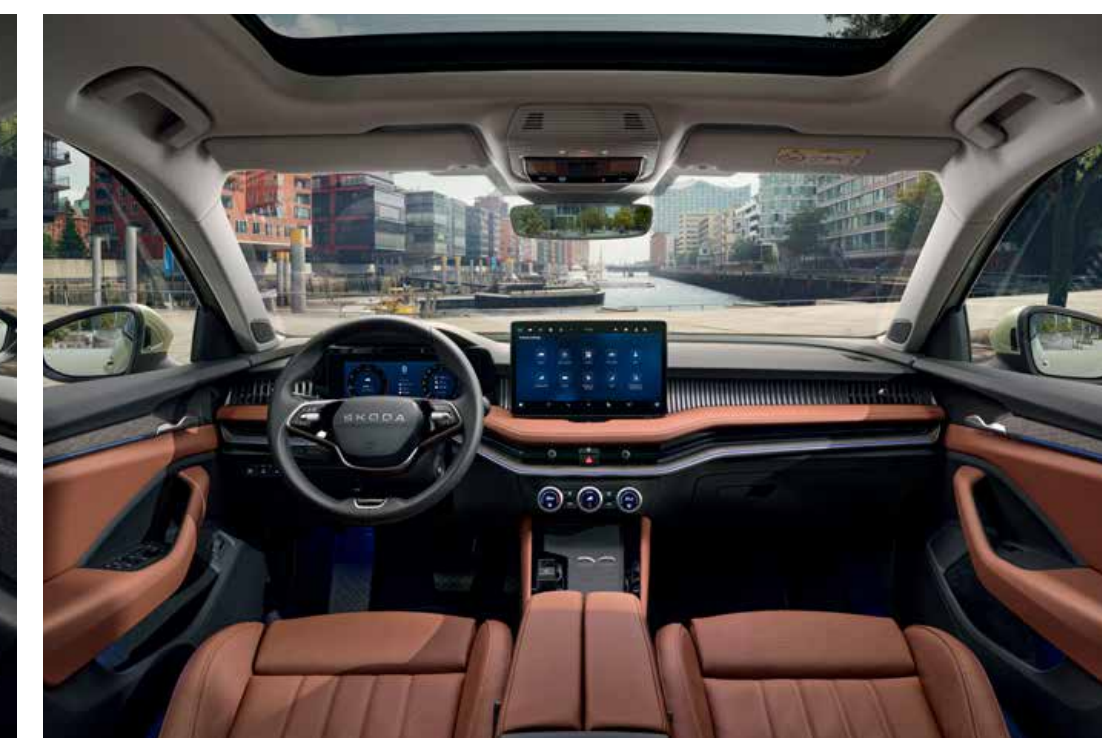
Interiér Suite hnědý Cognac