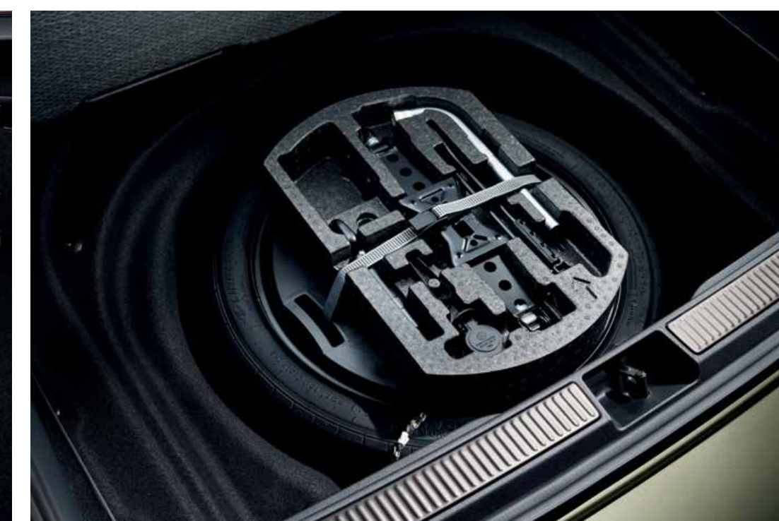
Rezervní kolo (dojezdové)