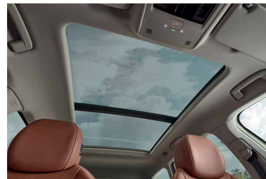
Panoramatické střešní okno (pouze pro Combi)