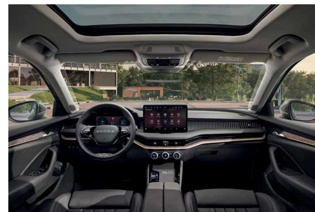
Interiér L&K černý