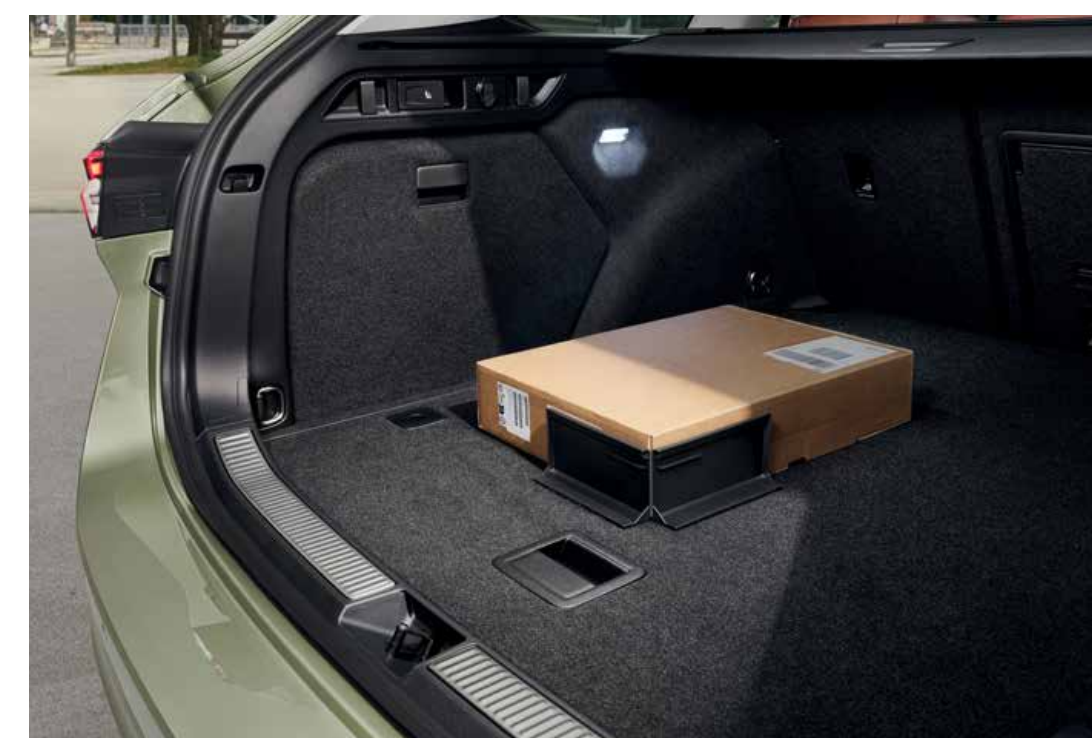
Dvojitá podlaha s cargo elementy (pouze pro Combi)